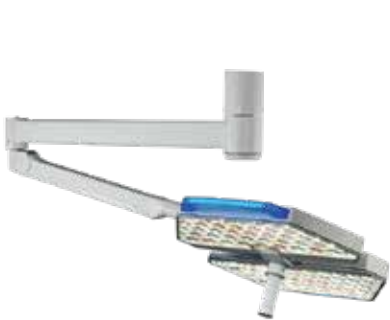
Niedrigraumversion: volle Bewegungsfreiheit bei geringen Raumhöhen

Zur optimalen Anwendung in unterschiedlichen OP-Situationen und Räumlichkeiten ist die TL5000 OP-Leuchte in verschiedenen Ausführungen erhältlich und überzeugt so mit einem vielfältigen Einsatzspektrum und Investitionssicherheit.