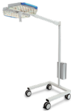
Mobile Version: Aushilfs- und Zusatzleuchte für den flexiblen Einsatz