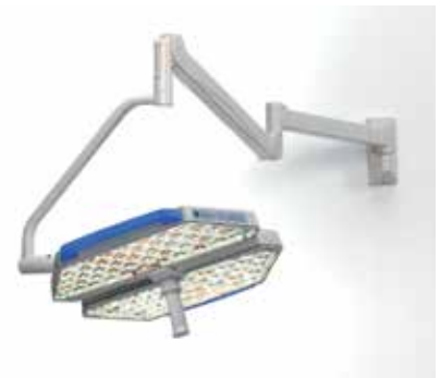
Wandausführung: ideal bei speziellen Infrastrukturbedingungen und Arbeitsabläufen