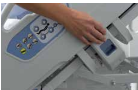
Entriegelung der Seitensicherung in einem Schritt