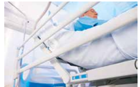
Line-Of-Site Anzeige ermöglicht einfache Patientenpositionierung