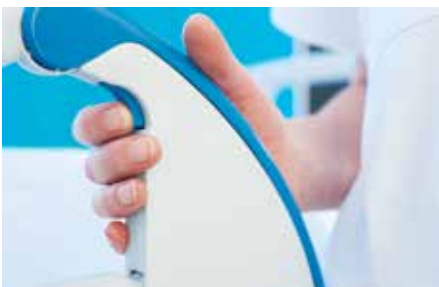
Doppelte Verriegelung erhöht die Sicherheit