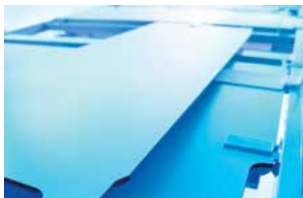
Pflegeleichte Oberflächen bieten verbesserte Hygiene