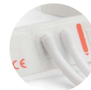
Neugeborenen-Einmalmanschette Zwei Schläuche