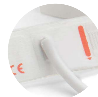
Neugeborenen-Einmalmanschette Ein Schlauch